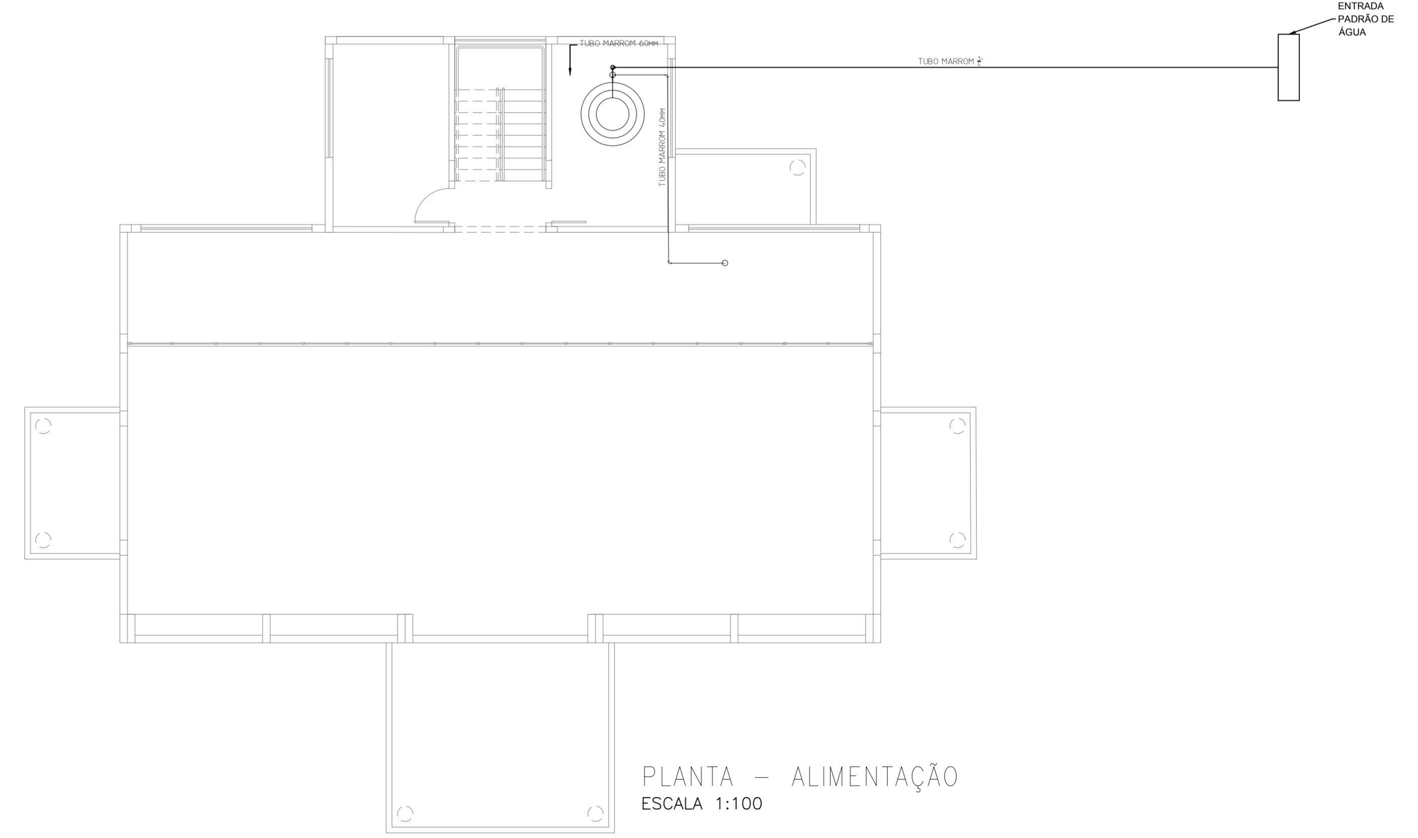
PLANTA - ALIMENTAÇÃO ESCALA 1:100